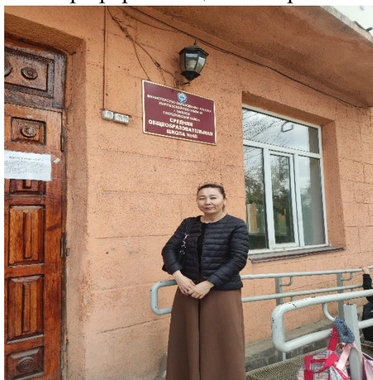
Фото о профориентационной работы по школе гимназия № 45 прилагаются.

СОШ №45, находится по адресу г. Бишкек, ул. Салиева, дом 186.