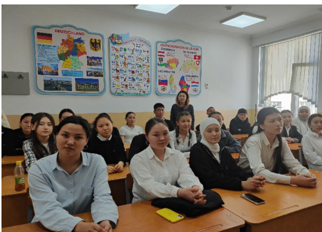
Фото о профориентационной работы по школе гимназия № 78 прилагаются.

Школа гимназия №78, находится по адресу г. Бишкек, ж/м Колмо ул. Илим 10.