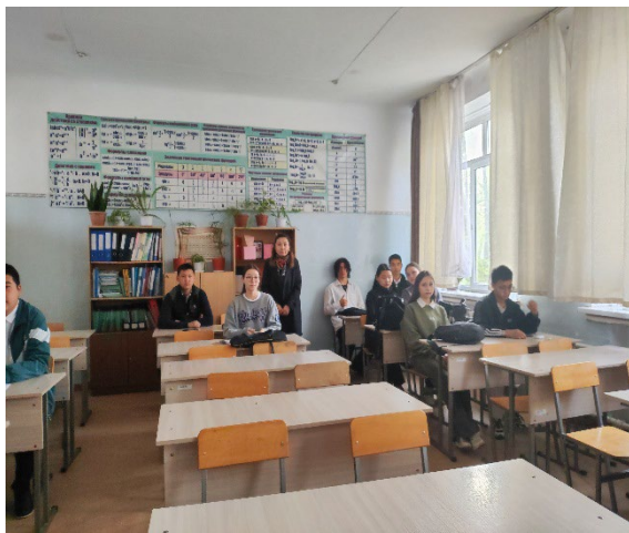
Фото о профориентационной работы по школе гимназия № 19 прилагаются.

СОШ №19, находится по адресу г. Бишкек, ул. Кулиева, д. 187 А