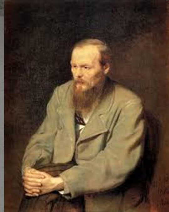
Ф.М. Достоевский (1821-1881)