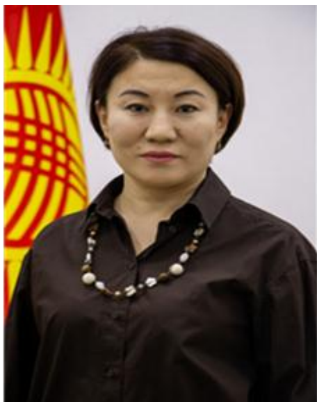
СЫДЫГАЛИЕВА НАЗГУЛЬ КУМАРБЕКОВНА Уполномоченный по вопросам предупреждения коррупции Министерства экономики и коммерции Кыргызской Республики, магистр гос. управления